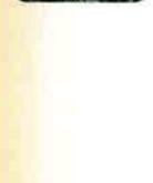
足場が危ないロープ、チェーンあり

平沢峠の駐車場内に軽食がとれる売店があります。 ◎不特定 ◎営業期間:4月下旬~10月